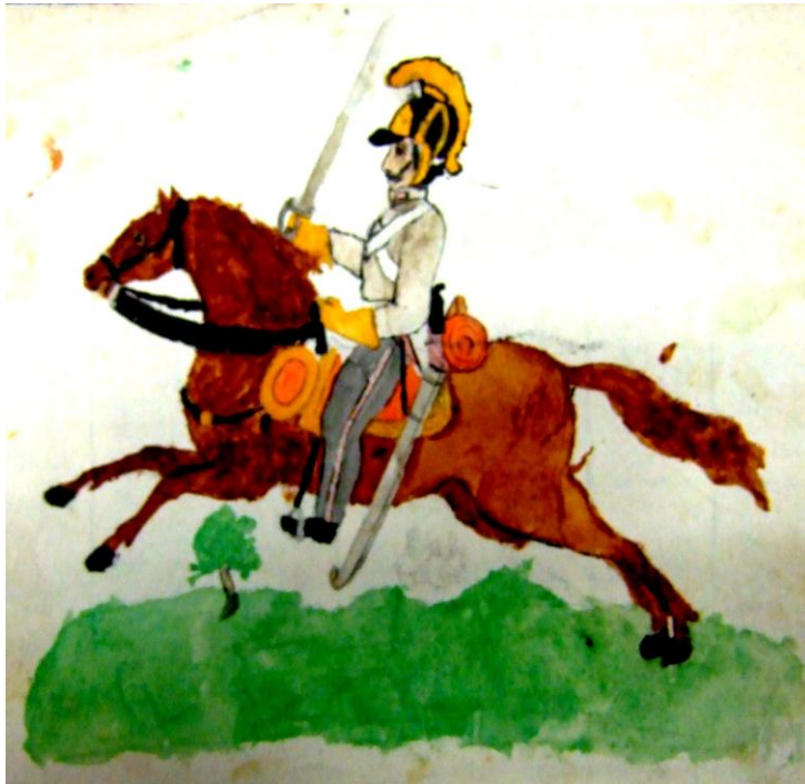
2. František Thun: Husar na koni, dětská kresba, kolem 1815. (SOA Litoměřice, pobočka Děčín, RA Thun-Hohensteinů, A3 XVIII, dodatky VII., kresby.)